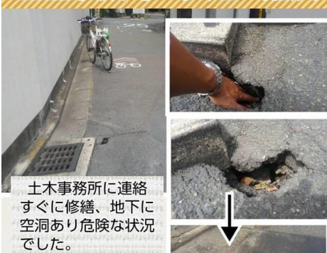
土木事務所に連絡すぐに修繕、地下に空洞あり危険な状況でした。